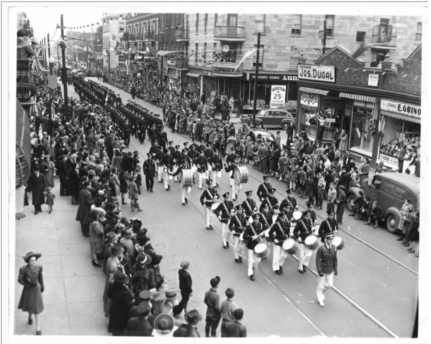
Cette très belle photographie nous montre l'avenue du Mont-Royal angle Bordeaux, au moment d'une parade marquant les fêtes du « Festival du Commerce » en 1941. L'espace qu'occupera le Steinberg en 1949 est à droite, où l'on voit les petits bâtiments d'un étage.

Sur ce détail de la photo précédente, on voit le commerce initial que la Famille Steinberg tient sur Mont-Royal. La raison sociale est « Wholesale Groceteria » et il s'agit d'une petite épicerie qui offre déjà ses produits avec quelques aperçus de ce que sera le supermarché en devenir. C'est le troisième commerce à l'ouest de Bordeaux et l'on voit les commis dehors, avec leurs tabliers blancs. La famille Steinberg exploite une bonne douzaine de ces petites épiceries à Montréal.