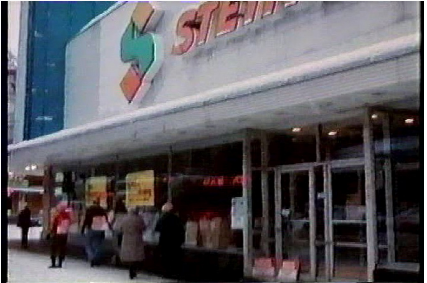
La succursale du Steinberg's au coin de Bordeaux (vers les années 1970). Le bâtiment est aujourd'hui occupé par une pharmacie bien connue. L'essentiel du bâtiment est toujours en place.

Tiré de Un ange cornu avec des ailes de tôle 1994 – Éditions Léméac / Actes Sud