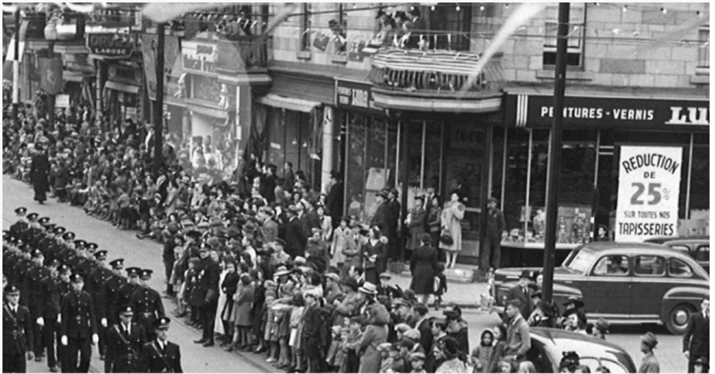
Vive le Plateau Mont-Royal ; plein des surprises, plein de vie, plein de récits... plein de tout ce que vous voulez !