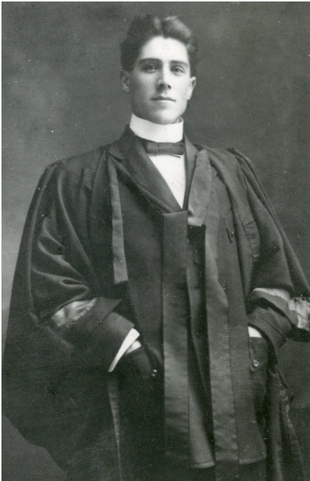
En 1910, il devient notaire et on ne peut nier qu'il a fière allure avec sa toge et son nœud papillon. Il est à pied d'œuvre pour de nombreuses tâches et une longue carrière.